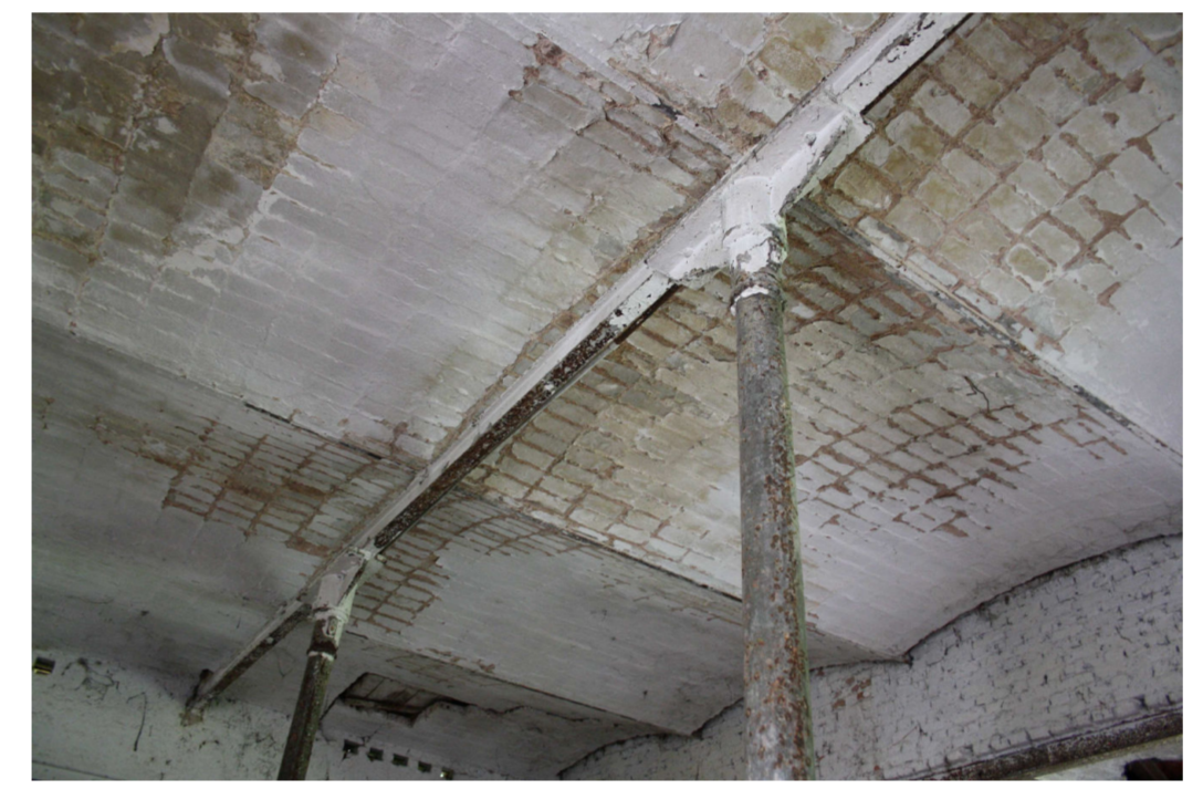
gesamte Träger abstrahlen + Brandschutzanstrich Träger im Bereich der Kappendecken

Sockel und einzelne Steine vom Mauerwerk aufarbeiten lassen! Böden neu + Höhen ausgleichen! gesamte Träger abstrahlen + Brandschutzanstrich